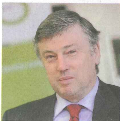
CLAUDE D'HARCOURT Le préfigurateur dont le travail est la santé

► Le capitaine du SLUC Nancy vient de fêter sa 200 e sélection avec les Bleus lors des matches de préparation à l'Euro 2015 de basket qui se disputera en France du 5 au 20 septembre. Il a franchi ce cap avec l'aisance et le naturel qui caractérisent les très grands joueurs. Pilier de la bande à Parker, leader défensif, préposé aux tâches ingrates pour neutraliser les grosses pointures adverses, il est un personnage à la volonté tendue qui a une tranquille influence sur ce groupe en quête d'un deuxième titre européen. Avec lui, les Bleus ont la certitude qu'ils peuvent se mesurer et battre n'importe qui, n'importe où. Revêtu de bleu, l'homme de base du SLUC qui exerce sur l'adversaire une pression défensive suffocante, va marquer la rentrée.